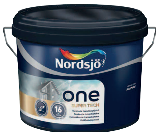
One Super Tech 10L