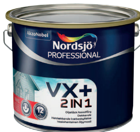
Pro VX+ 2in1 10L